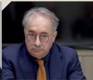
Guido Colombo Orchestra