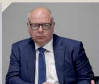
Davide Cucinella Grinding Technology